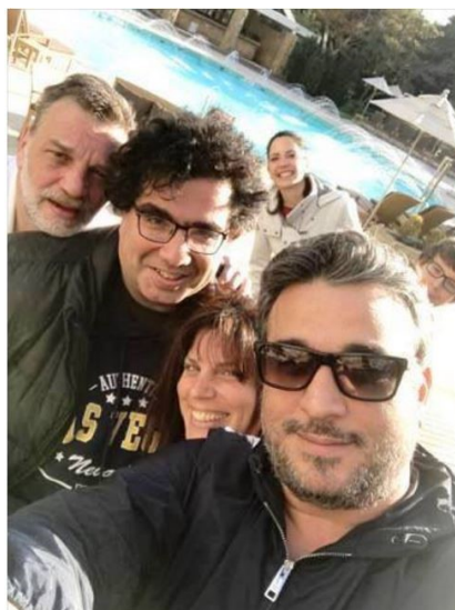
Lema, Versace, Tokay