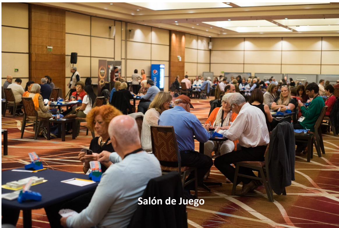
Salón de Juego