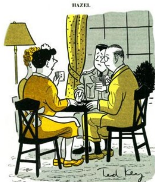
Salen de los reyes en la fuerza aérea mayor?